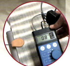
プラグインアースを接続した場合 8V/m