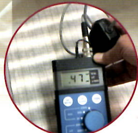
プラグインアース未接続の場合 470 V/m